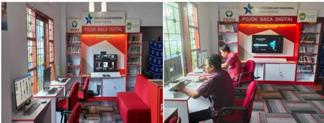
Gambar 1.3 Pojok Baca Digital