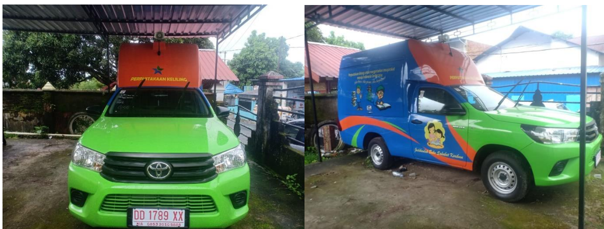
Gambar 1.4 Mobil Perpustakaan Keliling