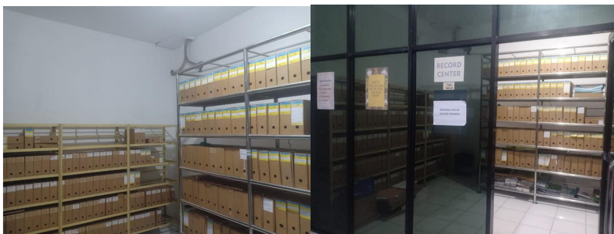
Gambar 1.5 Ruang Record Arsip