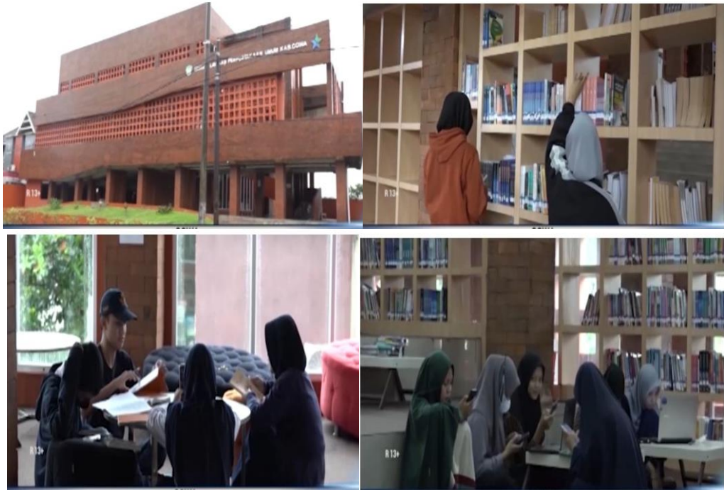
Gambar 1.3 Gedung Layanan Perpustakaan Umum Daerah